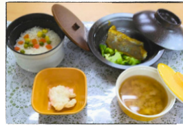
バターライス さわらのカレー焼き みそ汁 ポテトサラダ