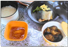
サバの塩焼き 揚げなすの煮物 大根おろし